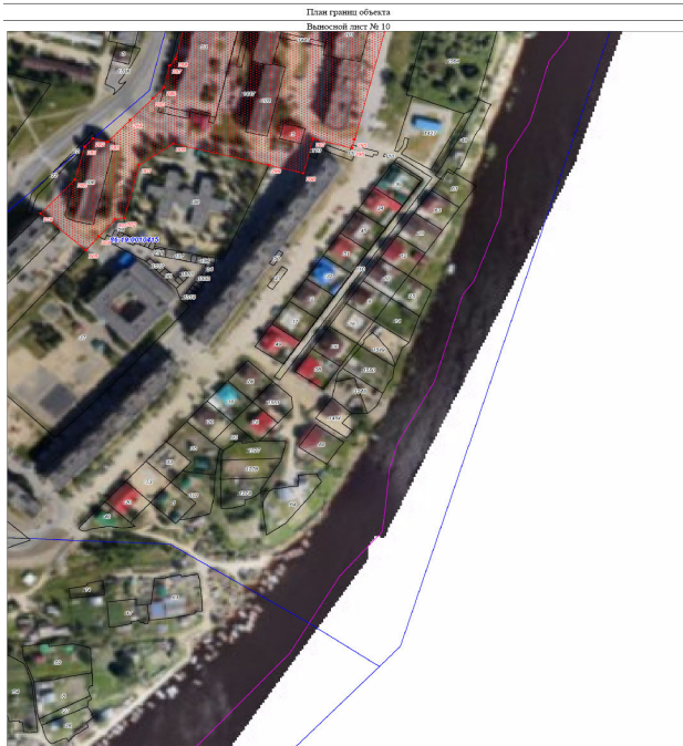
Условные обозначения территории объектов недвижимости Исходящий лист № 10 Масштаб 1:2000 Исходящие условия задела и обозначения Дата 14.06.2019 г.