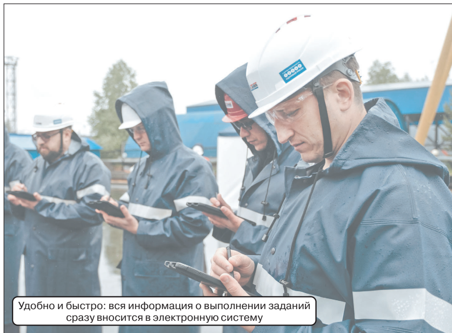
Удобно и быстро: вся информация о выполнении заданий сразу вносится в электронную систему

развитию массового и профессионального спорта, регулярно выделяя средства на проведение крупных турниров и соревнований. В 2017 году в “Славнефть-Мегионнефтегазе” был дан старт волонтерскому движению. Сегодня его активными участниками являются свыше полусотни человек. За время действия проекта волонтеры провели десятки акций, направленных на профессиональную ориентацию школьников, пропаганду здорового образа жизни, оказание помощи социально незащищенным категориям населения, а также сохранение культурного и духовного наследия.