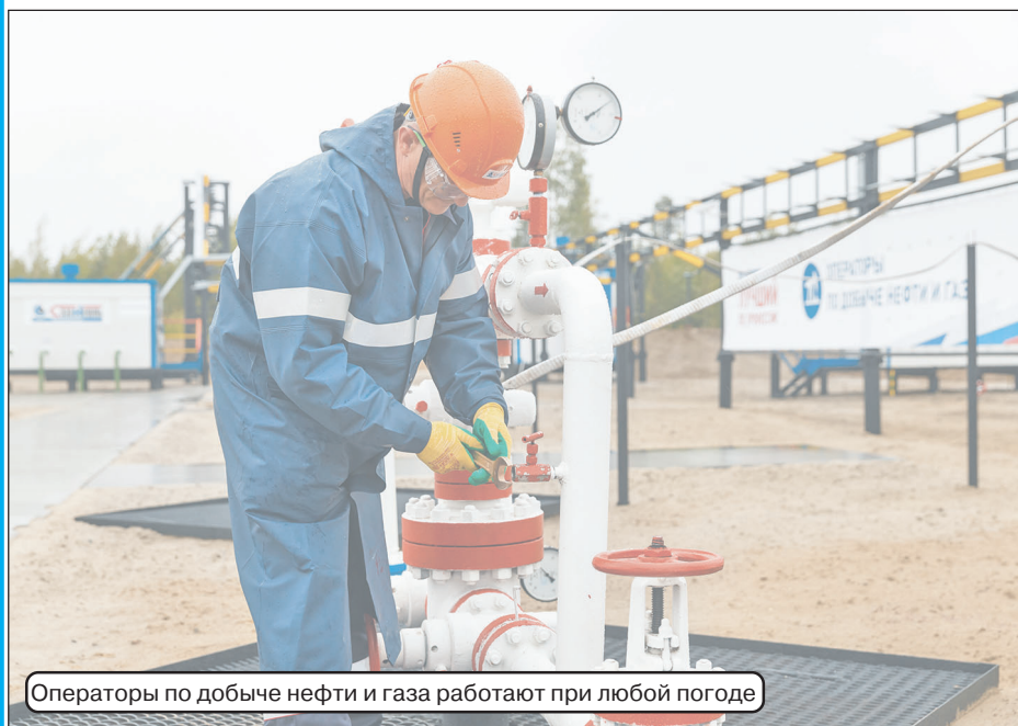
Операторы по добыче нефти и газа работают при любой погоде