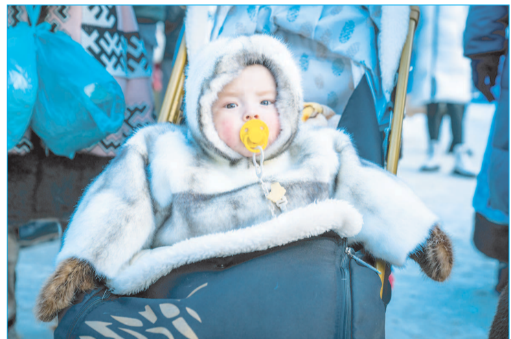
В этом году в Югре ввели или усилили 15 мер поддержки коренных малочисленных народов

Не про отчётность, а про людей. Про тех, кто, как сказал губернатор, "служит и делу, и людям".