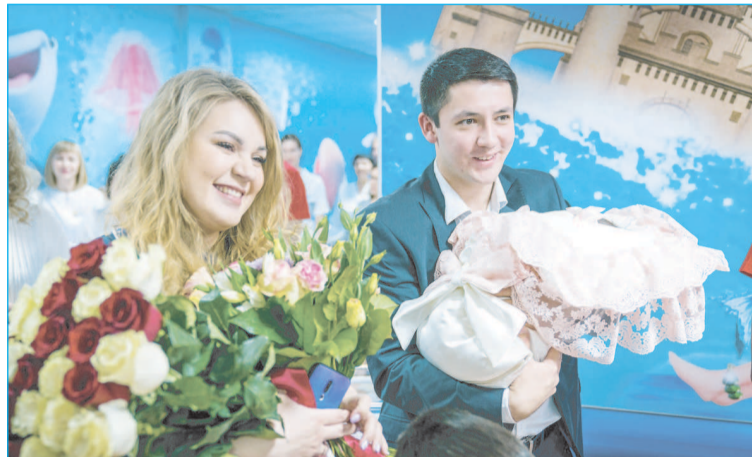
Поддержка семьи, создание условий для рождения и воспитания детей - приоритеты правительства Югры