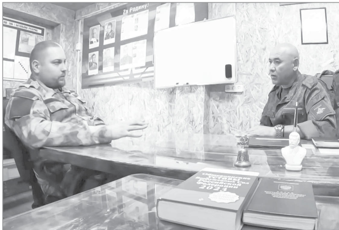
У нас все получится, он в этом уверен, ведь Россия несет в мир добро

- В 2013 году у нас был юбилей выпуска. Встретили нас, россиян, холодно. Впрочем, даже когда мы выпускались, уже тогда проявлялись искорки этого национализма, и казалось, что закончится все чем-то очень нехорошим. Не любили там наших, называли москалями. В 1991 году, 7 ноября, мы, курсанты, стояли в колонне перед воинским парадом на Крещатике. Напротив была гостиница, из окон которой молодчики маха-