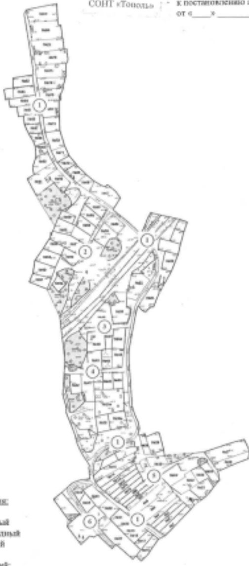
Приложение к постановлению администрации города от «...» ... 2019 №...