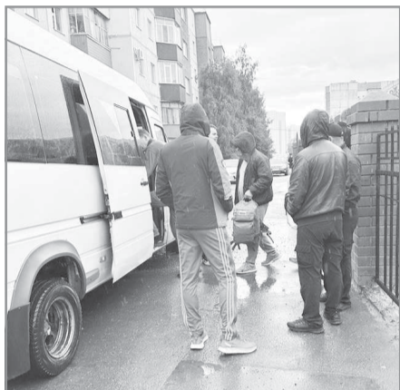
Каждый знает: о семье, которая остаётся в тылу, обязательно позаботятся

В ЛУЧШЕМ в стране пункте отбора на военную службу по контракту в столице Югры ребята подпишут контракт с Министерством обороны РФ и получат распределение по воинским частям. Напомним, с 1 августа внесены изменения в порядок предоставления выплат при заключении контракта на военную службу. Теперь, призываясь