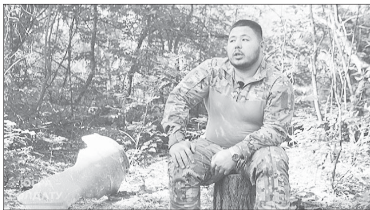
Экипаж в командире видит уверенность: если командир дрогнет, то и они дрогнут

Первой серьезной задачей для экипажа “Батра” стал штурм одного из населенных пунктов.