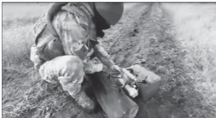
"Орел" на передовой специальной военной операции с декабря 2022 года

- Верим в то, что скоро будет наша победа и мы все вернемся домой, - говорит "Орел".