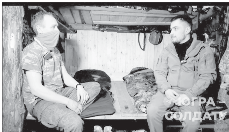
Во время одного из заданий боец увидел "глаза" противника - разведдрон ВСУ был прямо над головой

Виталий, передавая привет домашним, не сомневается, что скоро вернется с