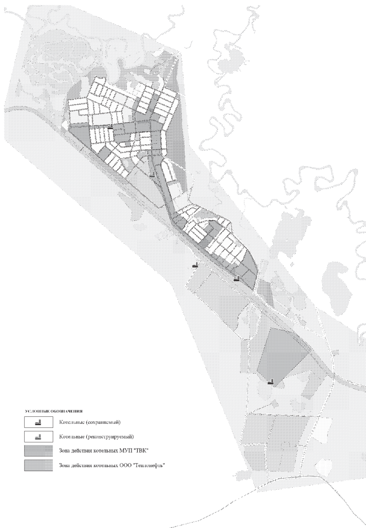
Рисунок 2.5 Схема перспективных зон действия котельных в п.г.т. Высокий на расчетный период до 2035 года