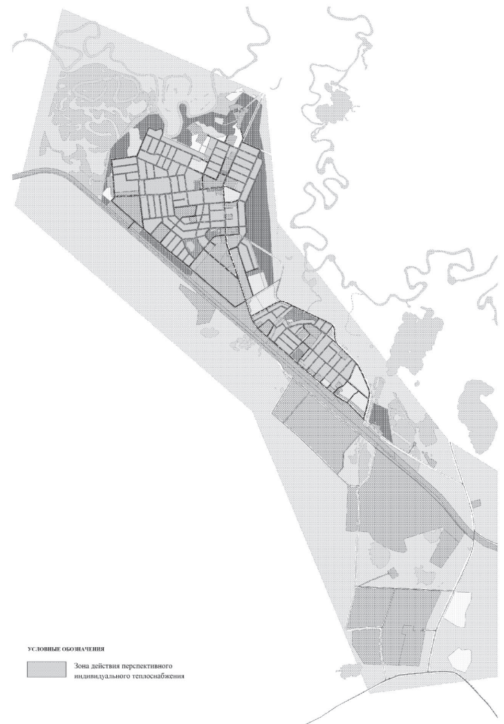
Рисунок 2.8 Зона действия перспективного индивидуального теплоснабжения в п.г.т. Высокий

2.3 Описание существующих и перспективных зон действия индивидуальных источников тепловой энергии