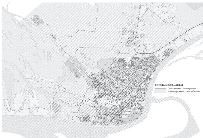
Рисунок 2.6 Зона действия существующего индивидуального теплоснабжения в городском округе город Мегион