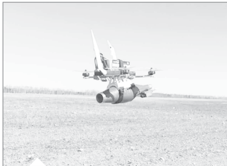
"Упырь" с гранатой ПГ-7В