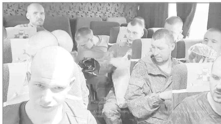
С подконтрольной Украине территории вернулись 75 российских солдат