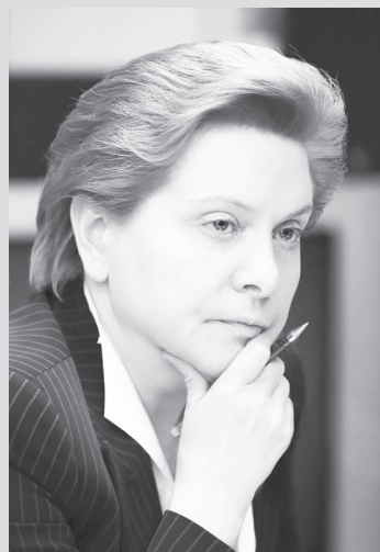
Наталья КОМАРОВА, губернатор Югры:

- Будет утвержден регламент деятельности рабочей группы по развитию экономики оперштаба по новой индустриализации экономики округа. И в этом оперативном порядке, хорошо организованном, будем разрабатывать решения и принимать их в соответствующем статусе решениями губернатора, Правительства или законами автономного округа, - резюмировала Наталья Комарова.