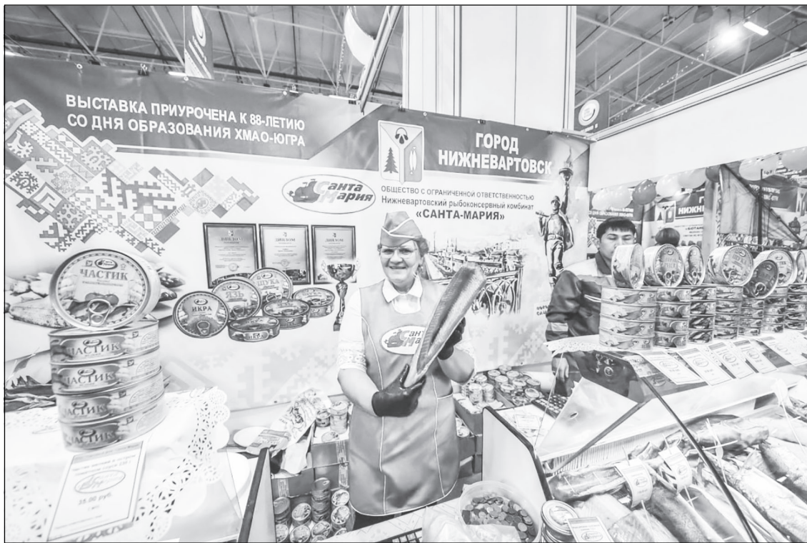
Рыбоконсервный комбинат "Санта-Мария" готов заменить санкционные продукты

Чтобы системообразующие организации и предприятия жизнеобеспечения работали