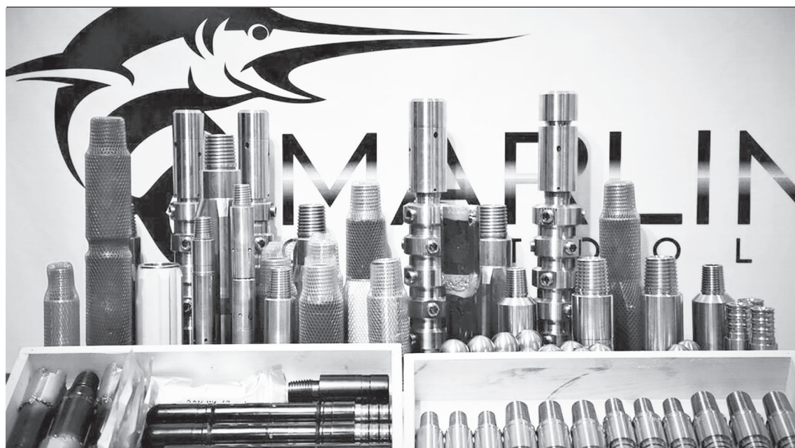
Компания «Марлин Ойл Тулз» с 2017 года занимается импортозамещением нефтяного оборудования

- В принятом плане предусмотрено оказание семьям с низкими доходами, семьям, имеющим детей-инвалидов, единовременной помощи в размере 5 тысяч рублей на каждого ребенка. Я одна воспитываю троих детей и знаю, что такая выплата - это ощутимая поддержка. В семьях с детьми, особенно многодетных, много денег уходит на продукты. А когда цены растут, эти траты особенно ощутимы для бюджета. Тем более сейчас заканчивается зима, нужно купить весеннюю одежду. Поэтому уверена, что выплата станет хорошим подспорьем для семей.