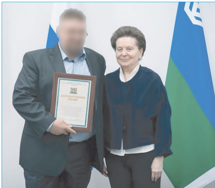
Глава региона также торжественно вручила благодарственные письма от своего имени участникам СВО и жителям региона.

Во время встречи были даны ответы на наиболее актуальные вопросы от членов семей военнослужащих, участников специальной военной операции, поступающие в адрес югорских общественников.