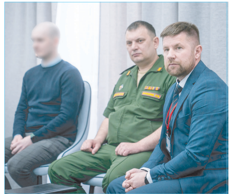
Участники отметили важность сохранения памяти о погибших.

Заместитель губернатора Всеволод Кольцов уточнил, что в