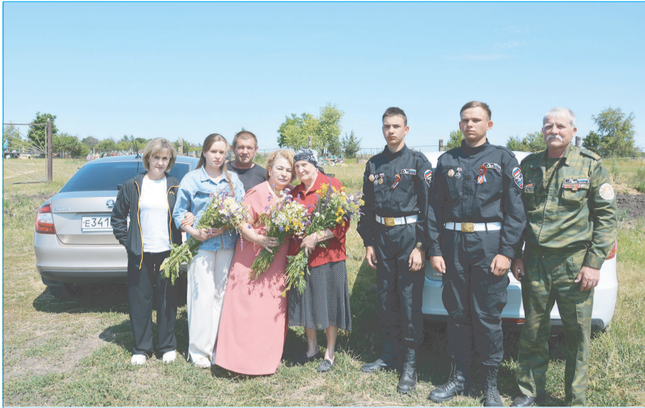
В конце июня вернулись из экспедиции участники поискового отряда "Истоки", которые с 6 по 27 июня несли очередную "Вахту Памяти - 2023" в местах бывших боев Сталинградской битвы.