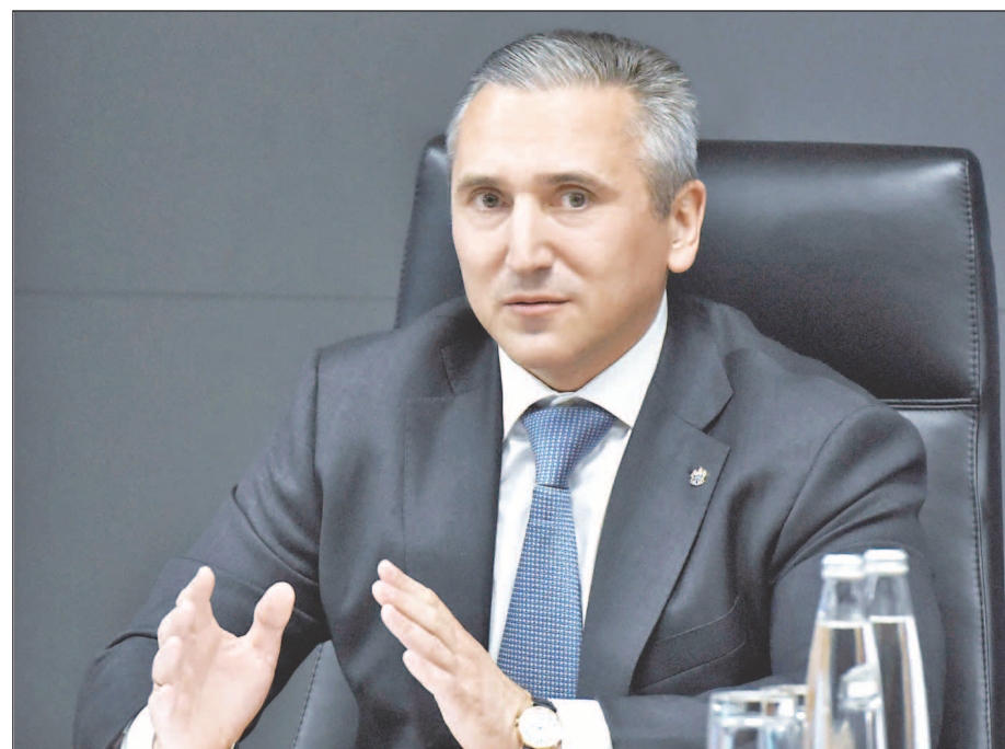
Оплата публикации произведена за счет средств избирательного фонда кандидата на должность губернатора Тюменской области Александра Викторовича Моора.

В результате жителей Югры будет радовать не только качество поставляемых с юга Тюменской области товаров, но и их цена.