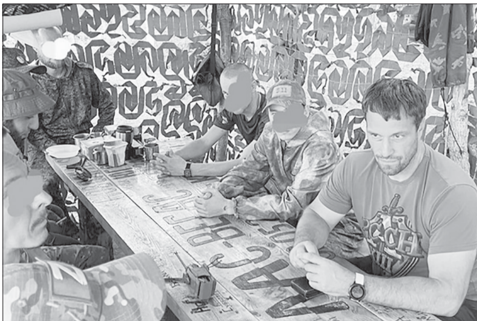
Подаркам и приезду сенатора из Югры очень обрадовались в подразделении, где служат 60 югорчан