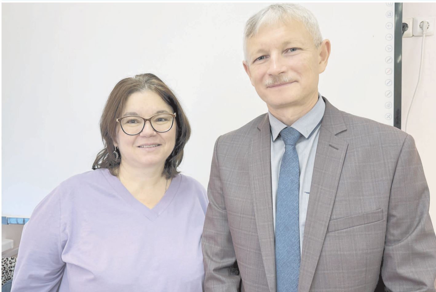
ТВОИ ЛЮДИ, ГОРОД