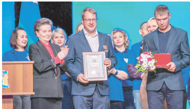
Наталья Комарова вручила государственные награды общественникам, волонтерам и медработникам

ответствующие решения. В 2023 году механизмы комплексного развития территорий будут использовать также Ханты-Мансийск, Путь-Ях, Нягань, Советский и Нижневартовск, - отметила Наталья Комарова.