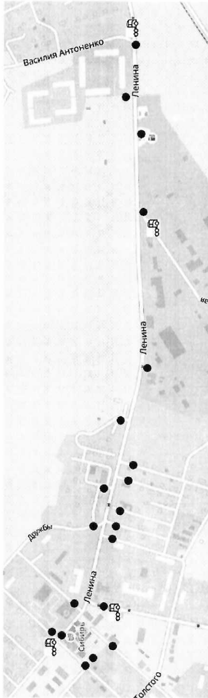
Схема перекрытия в поселке городского типа Высокий в период проведения празднования 77-ой годовщины Победы в Великой Отечественной войне 1941-1945 годов

● - Места перекрытия на время ограничения движения