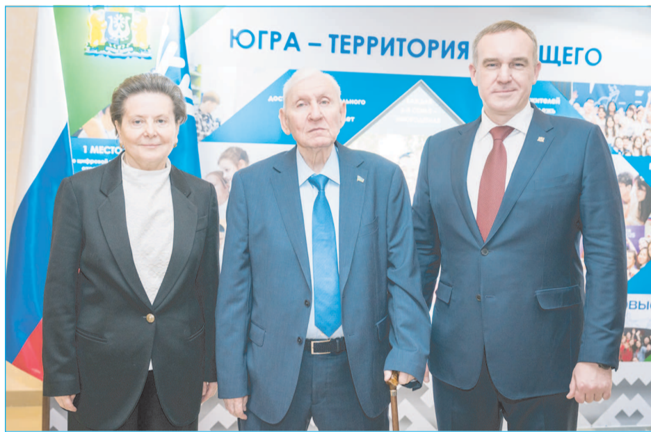
Три губернатора Югры - три поколения жителей региона

Он отметил, что сегодня Югра - это лидер нефтегазовой отрасли, обеспечивающий энергетическую безопасность нашей страны, это территория инновационных технологий и передовых производств, это регион с развитой социальной инфраструктурой, где создаются условия для комфортной жизни, это земля, бережно хранящая многовековую историю коренных малочисленных народов