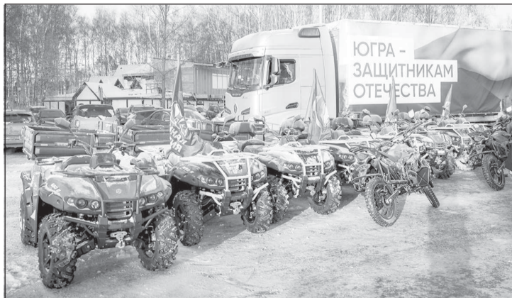
По заявкам военнослужащих и воинских частей на передовую передали 8,8 тысяч единиц высокотехнологичной электроники: 8 829 БПЛА и FPV-дронов, 436 единиц транспорта

ЮГРА - лидер по обеспечению и поддержке бойцов СВО. Здесь не только выплачивают самые большие единовременные выплаты для заключивших контракт, но и поддерживают их на всем протяжении службы. По заявкам военнослужащих и воинских частей на передовую передали 8,8 тысяч единиц высокотехнологичной электроники: 8 829 БПЛА и FPV-дронов, 436 единиц транспорта, в том числе 148 квадроциклов и 205 мотоциклов.