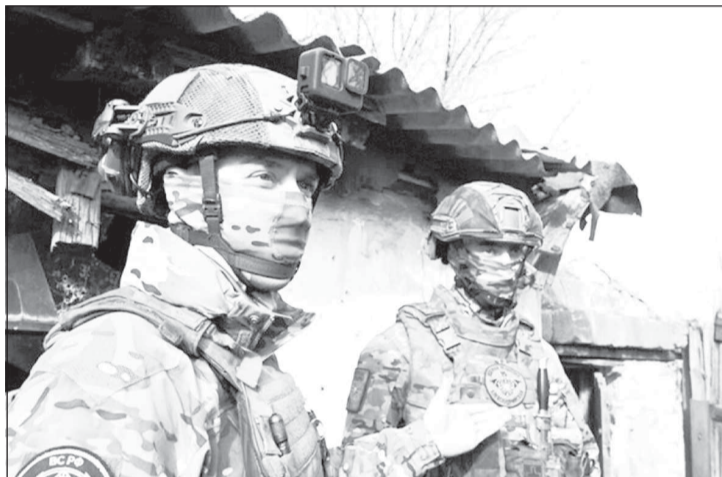
Весь расчет БПЛА и командир подразделения получили 10 миллионов рублей

ВОИНЫ -контрактники из Югры отмечают, что рекордная для России выплата в 4 100 000 рублей на старте службы - лишь "подъемные", чтобы заработать, когда имеешь и желание бить врага, и профессионализм в выполнении целей. Возможностьюкратноувеличитьпервоначальныйкапиталиобеспечитьсемьюнагодывпередстановятсявыплатызаподбитуювражескуютехнику.