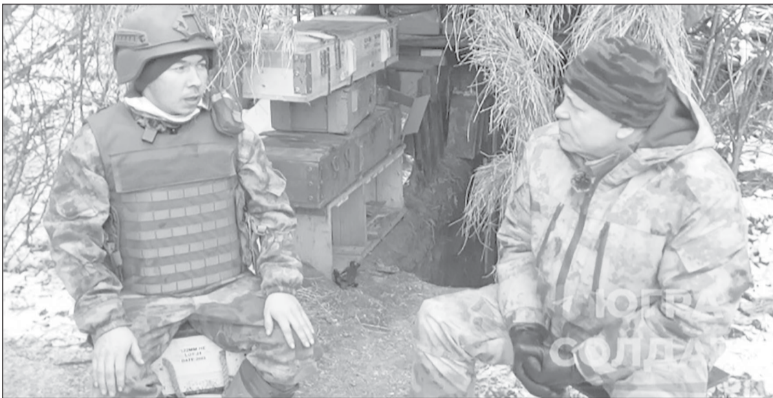
Сейчас думаю, что, наверное, если бы не призвали тогда, сам бы подписал контракт