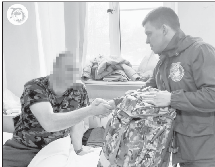
Сотый набор “Югра солдату” вручили в госпитале мобилизованному сургутянину, который получил тяжелое ранение, прикрывая боевого товарища

Он уже во второй раз ранен - и оба раза он прикрывал от осколков своих бойцов. В первый раз прилетела 120-миллиметровая мина, в этот - их атаковали вражеские БПЛА. Чтобы