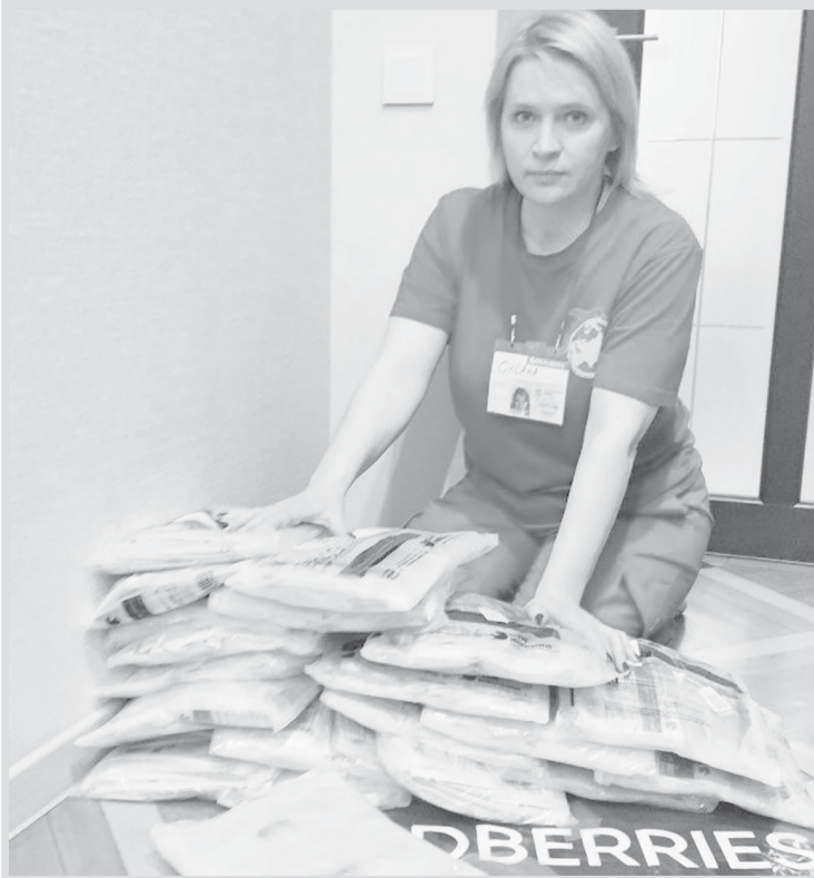
Помощь от Югры получили в Ростове-на-Дону

В перечень необходимых материалов входят влажные салфетки, одноразовые пеленки больших размеров, резиновые перчатки размером M, XL, костыли, нательное белье, хлопковые футболки, термобелье, резиновые сланцы, средства по уходу за телом для лежачих больных.