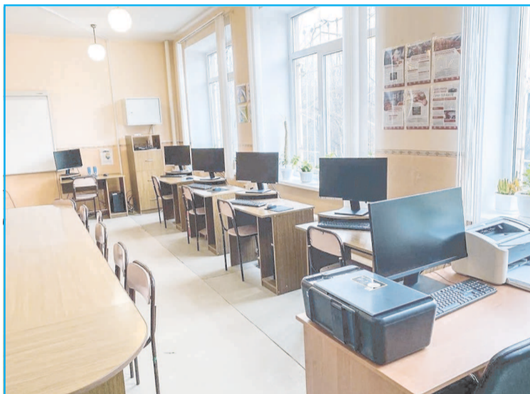
В 25 школах Макеевки выполнены работы по оформлению школьных пространств

«Только благодаря совместной работе наших территорий мы получили тот результат, который имеем. Жители Макеевки ощущают поддержку Югры и ее участие во всех направлениях нашей жизнедеятельности. Работа продолжается, мы верим, что в перспективе наш город станет одним из сильнейших населенных пунктов нашей страны.