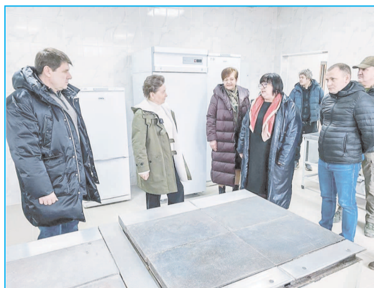
Обновление оборудования в школах для приготовления пищи и соответствие его российским стандартам крайне важно

« Мы вместе, мы слышим друг друга и готовы выполнять те задачи, которые требуются для того, чтобы мирная жизнь обслуживалась на высоких стандартах.