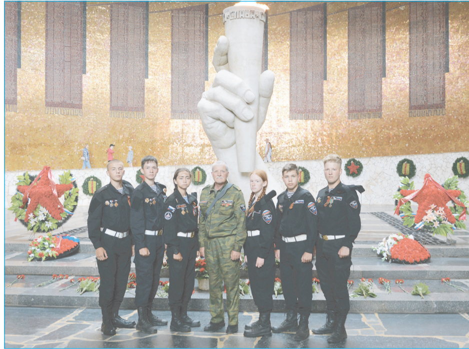
В июне 2024 года мегионские поисковики приняли участие в очередной экспедиции по местам бывших боёв Сталинградской битвы, которая проходила на территории Городищенского района Волгоградской области.

МГ-34, автоматные и пулемётные магазины, лопаты, противогазы, котелки, фляжки, кружки, сапоги, ботинки, ремни, пряжки, звёздочка от шапки, подсумки, зеркала, пуговицы, монеты, патроны, гильзы, гранаты, миномётные мины и снаряды.