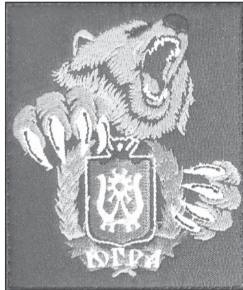
Первые образцы шеврона батальона сшили в Чебаркуле в июле 2022 года. А потом “медведь с когтями” перекочевал на флаг

- “Герой” - это не ко мне, я доброволец, - уточняет гвардеец, защитник российской земли с чеченскими корнями и русской фамилией. - Меня долг зовет, люблю, чтобы было честно все.