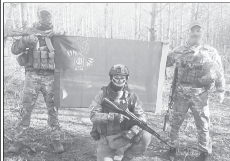
Изготовили четыре флага с югорским медведем, три из них ведут за собой бойцов, один как реликвия хранится дома, в Ханты-Мансийском районе

невыполнима, может отдать неверный приказ. Он не может себе позволить искать крайнего в неудачной атаке, он должен брать на себя ответственность.