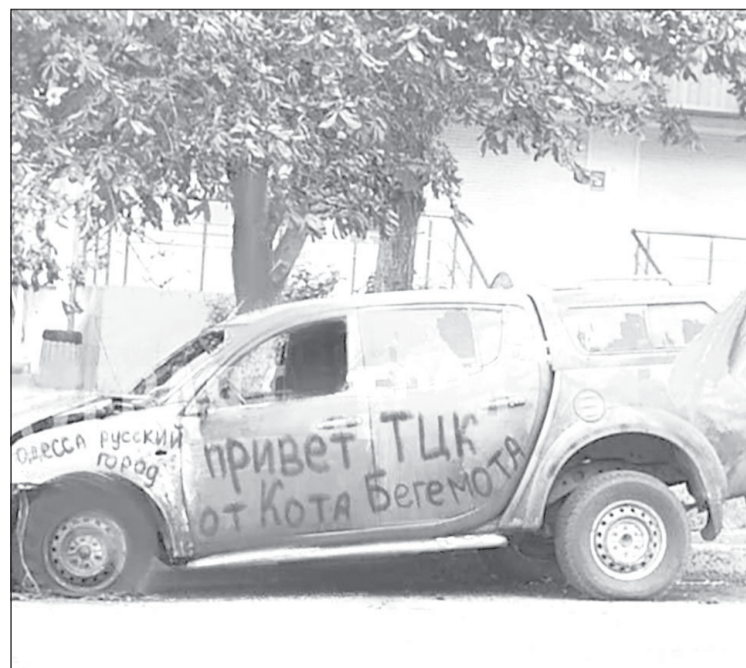
Так действуют партизаны-подпольщики в Одессе

Эксперты отмечают, что сейчас востребованы навыки не только классических партизанских отрядов, но и подпольщиков революционного движения с учетом современных методов конспирации. Однако такая деятельность несет огромные риски для самих партизан и их близких. Может быть, будет и новый праздник - подпольщиков бывшей Украины.