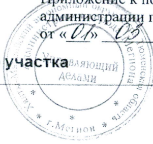
Схема земельного участка

Приложение к постановлению администрации города Мегиона от «01» 09 2021 № 452