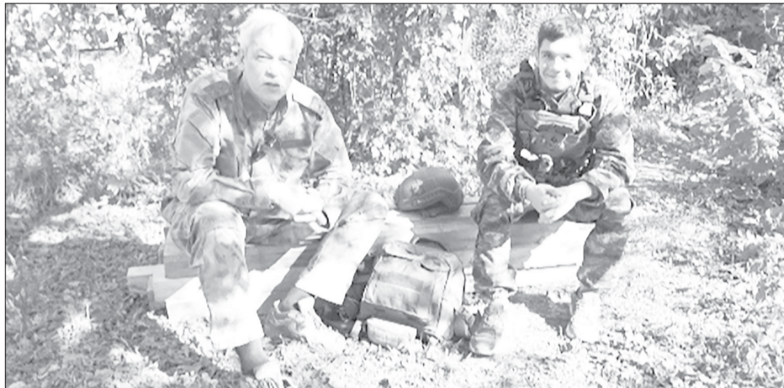
Наша цель - закончить это всё и с победой вернуться домой

С января отряд югорчан находился в зоне СВО, с марта - уже “за ленточкой”. Тогда же, в марте, Дани-