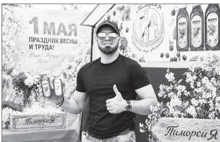
Все самое лучшее начинается с заботы о близких

После школы хотел пойти в колледж. Но мама спросила: как расскажешь своим детям, что в армию не пошел? Поэтому отслужил срочную под Самарой в подразделении материально-технического обеспечения батальона связи. Армейская жизнь ему понравилась: он научился взаимодействовать с людьми, получил опыт ответственности. После демобилизации Алек-