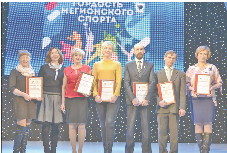
14 марта во Дворце искусств Мегииона состоялась ежегодная церемония чествования лучших спортсменов и тренеров нашего города “Спортивная элита - 2018”