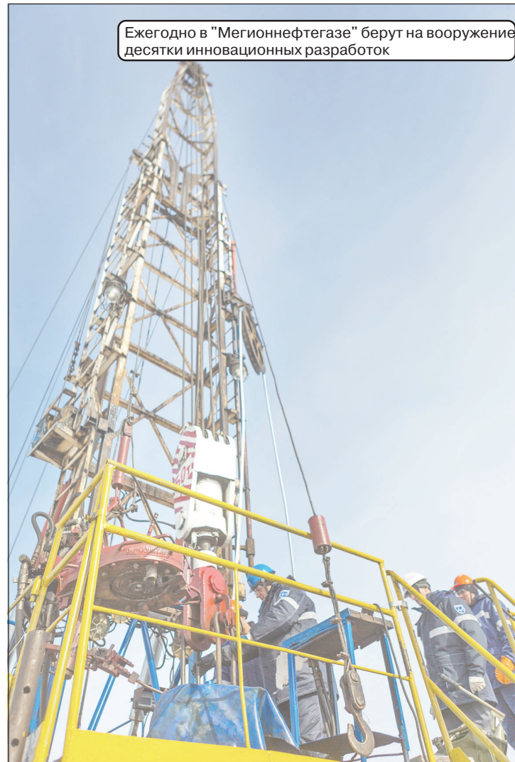
Ежегодно в «Мегионнефтегазе» берут на вооружение десятки инновационных разработок

Еще один пример, наглядно демонстрирующий, как цифровизация повышает эффективность и безопасность, - Центр