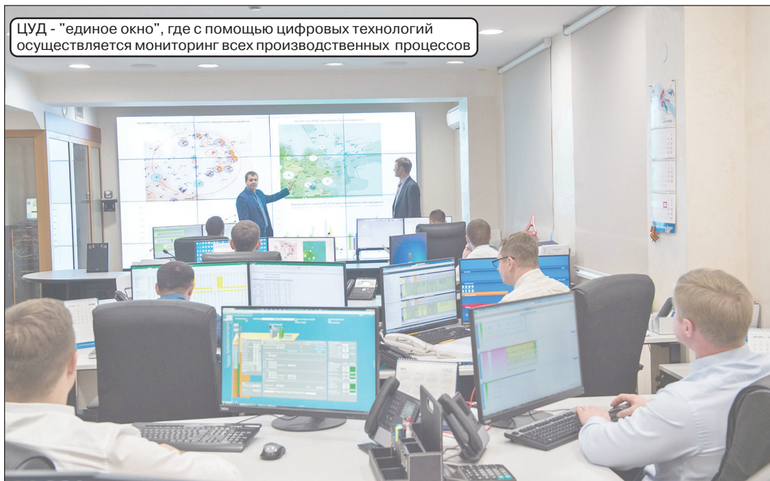
ЦУД - "единое окно", где с помощью цифровых технологий осуществляется мониторинг всех производственных процессов

Добиваться высоких результатов в различных направлениях деятельности «Мегионнефтегазу» позволяет и применение современных цифровых техно-