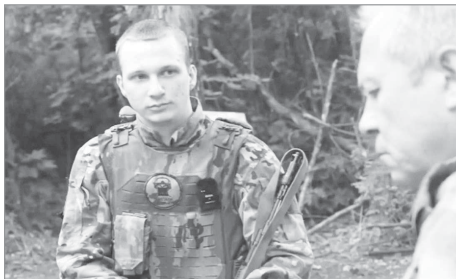
Парням очень нужна наша помощь - и прежде всего наше глубокое убеждение в том, что они герои и что победа будет за нами