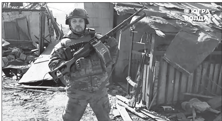
«Север» выжил. Вылечится. И снова встанет в строй