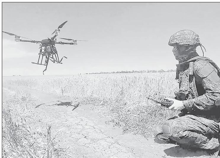
Беспилотники на передовой сегодня - это глаза и уши бойца

СОВРЕМЕННЫЕ подразделения ВС РФ ежедневно пополняют наши земляки, которые любят и умеют обращаться со сложной летающей техникой и очень хотят применить, защищая страну, навыки, полученные в мирной жизни.