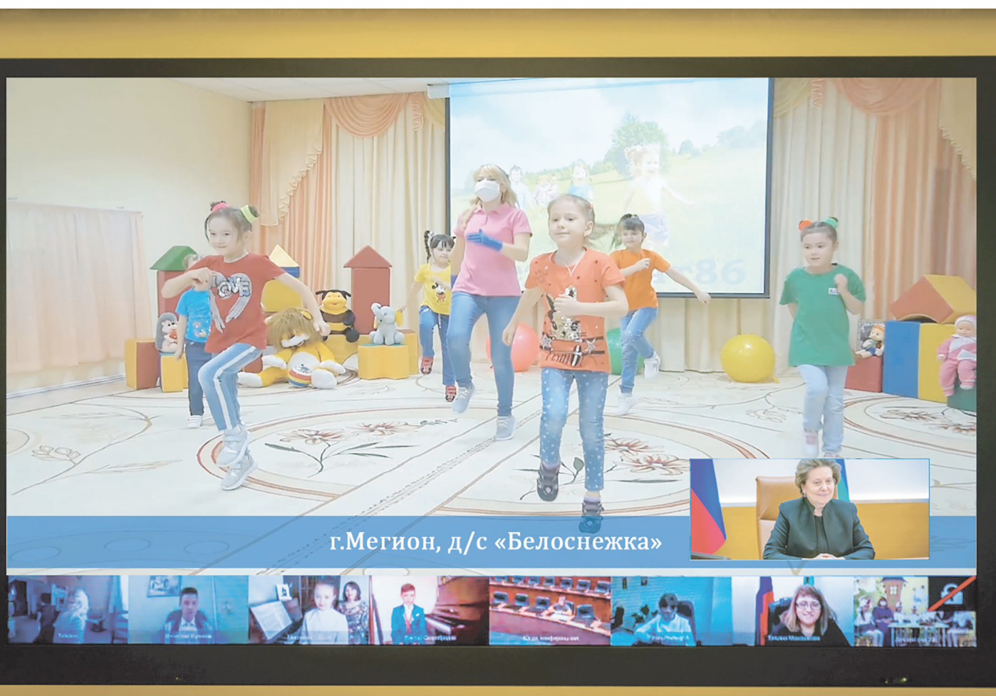
г. Мегион, д/с «Белоснежка»

Издается со 2 марта 1992 года. Выходит два раза в неделю. Распространяется бесплатно. 12+