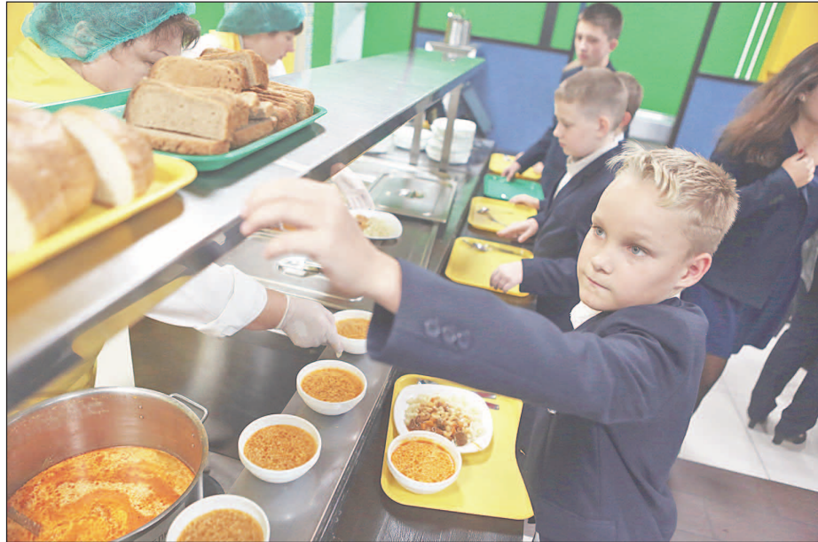
Ситуация находится на контроле Правительством автономного округа.