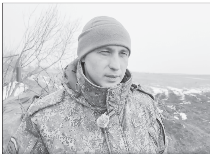
Сегодня, спустя два года, "Газик" уже опытный боец

Напомним, в Ханты-Мансийском автономном округе предлагаются лучшие условия при заключении контракта на службу в ВС РФ в стране. При заключении контракта в Мегроне боец получает единовремененно 3 200 000 рублей. Денежное довольствие военнослужащих за 12 месяцев службы составит от 5 720 000 рублей. Подробнее о службе по контракту - по телефону в Мегроне + 7 (932) 412-35-98.