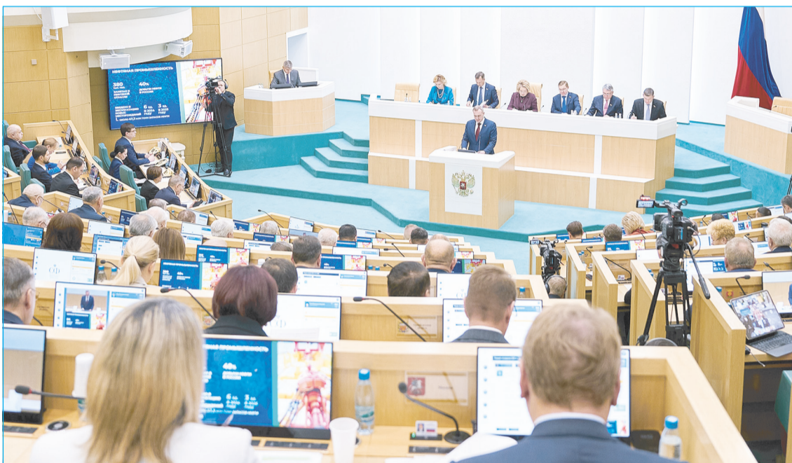
Югру назвали опорой России и отметили социальную поддержку в регионе