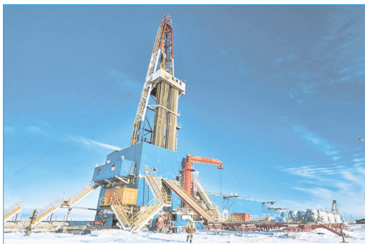
Налоговые льготы для нефтяников сохраняют стабильность в Югре и России

Председатель верхней палаты парламента поблагодарила руководство округа за всесторон-