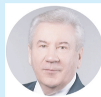
Борис ХОХРЯКОВ, председатель Думы Югры

Дни Югры в Совете Федерации дали нам возможность широко и предметно обсудить вопросы, которые сегодня связаны с развитием нашего региона. Это проекты, связанные с реализацией социальных программ по проектированию строительства новых объектов социальной, дорожной и транспортной инфраструктуры и жилищно-коммунального комплекса. Отдельное направление, которое поддержали сенаторы, - наши инициативы по донстройке федерального законодательства, которое ориентировано на поддержку нефтяной отрасли".