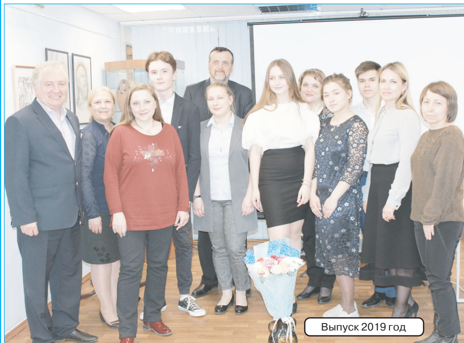
Выпуск 2019 год