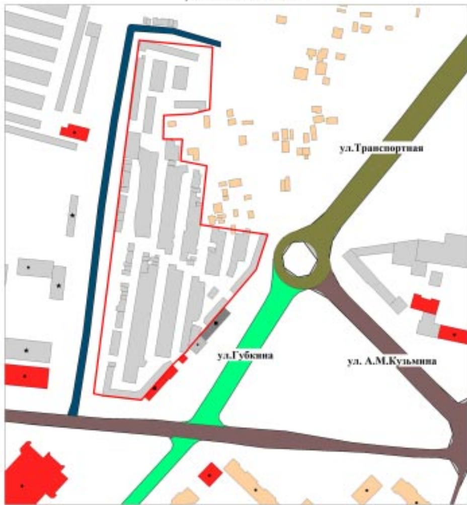
Обзорная схема расположения ПКК "Сигнал"

Приложение к постановлению администрации города от _____ 2018 № _____