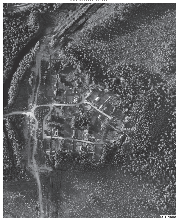
Обзорная схема территории СОНТ "Вышкарь-2" 86:04:0000001:97950

Приложение к постановлению администрации города от 04.02.2019 г. №203