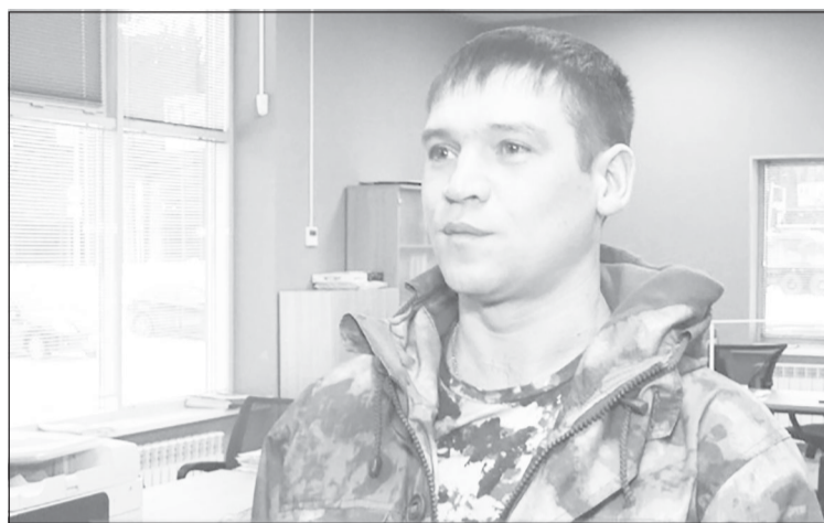
О том, чтобы уйти на СВО, думал долго, а решил всё в один момент

- У меня там много знакомых - штурмовики, мотострелки. Все время на связи с ними, все у них хорошо, все живы и здоровы. Может, конечно, не все рассказывают, но война есть