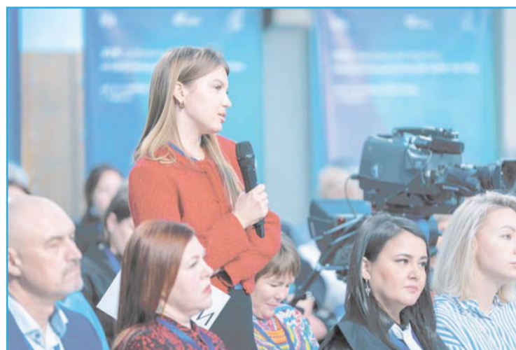
Подняли на пресс-конференции и чувствительную для всего округа проблему долгостроя

за иностранцами, которые приехали в Югру на заработки, именно в том, что часть из тех, кто приехал, не хотела трудиться, в итоге нарушала законодательство страны о пребывании в ней и часто попадала в совершенно иные сводки - криминальные.